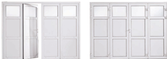
Modèle présenté : 4 vantaux à rupture de pont thermique, remplissage panneau lisse, avec partie haute vitrée en option, coloris RAL 9010