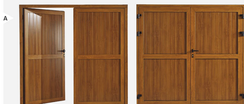
Modèle présenté : 2 vantaux à rupture de pont thermique, remplissage panneau alu Isolé à rainures, coloris chêne doré