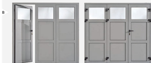
Modèle présenté : 3 vantaux à rupture de pont thermique, remplissage panneau lisse, avec partie haute vitrée en option, coloris RAL 7042